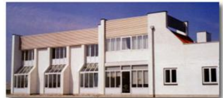
BUANCO SYSTEM A/S i Haarby